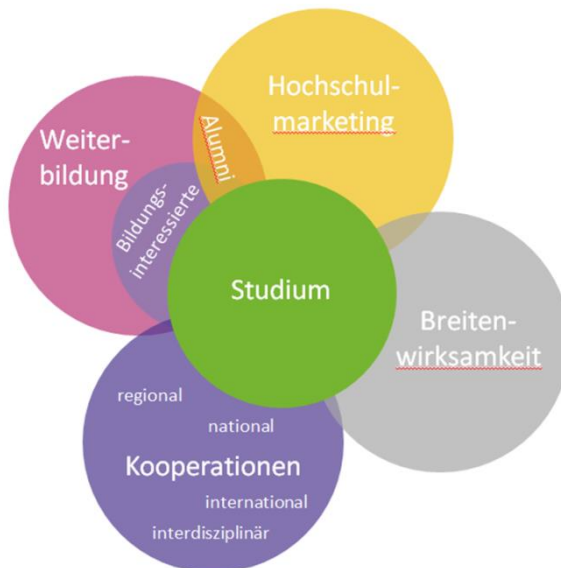
Schaubild 1: Überführung in den Hochschulalltag

Des Weiteren kann man die Angebote auch nach dem Grad der Integration in die akademische Lehre differenzieren. In der nachfolgenden Abbildung wird daher sowohl die Zeitachse als auch die Angebots-Achse berücksichtigt. Es wird hierbei nach Angeboten auf einer Kursebene, einer Modulebene und einer Studieneingangsebene unterschieden. Die Zeitachse differenziert wiederum verschiedene Zielgruppen.