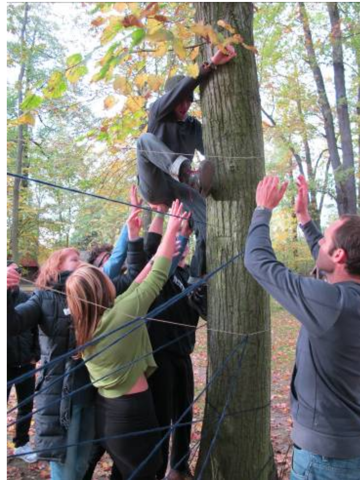
Mentoring am Studienanfang: Erstsemesterworkshop in Burg/Spreewald