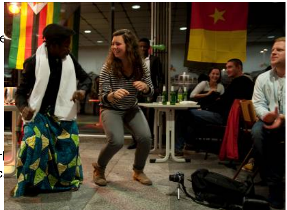
Afrikanischer Kulturabend 2012