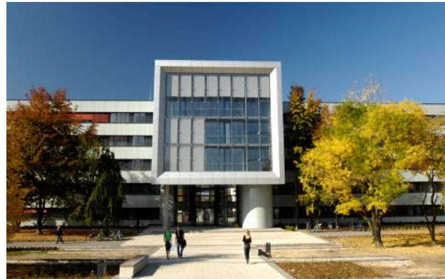
Eines unserer Workshopthemen: „Kopfnicken, Schweigen, Lächeln – zum Umgang mit chinesischen Studierenden“