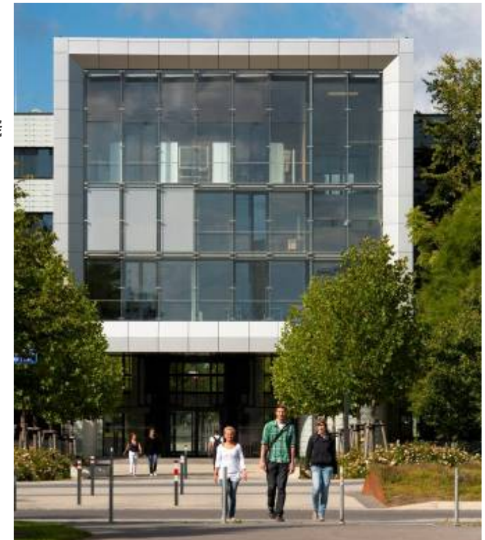
Das Hauptgebäude der BTU Cottbus

Grundstücksfläche: ca. 300.000 m 2 · Hauptnutzfläche: rund 82.000 m 2