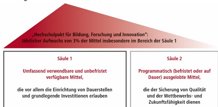
Abbildung 1: Finanzierungsmodell „Zwei Säulen-plus“