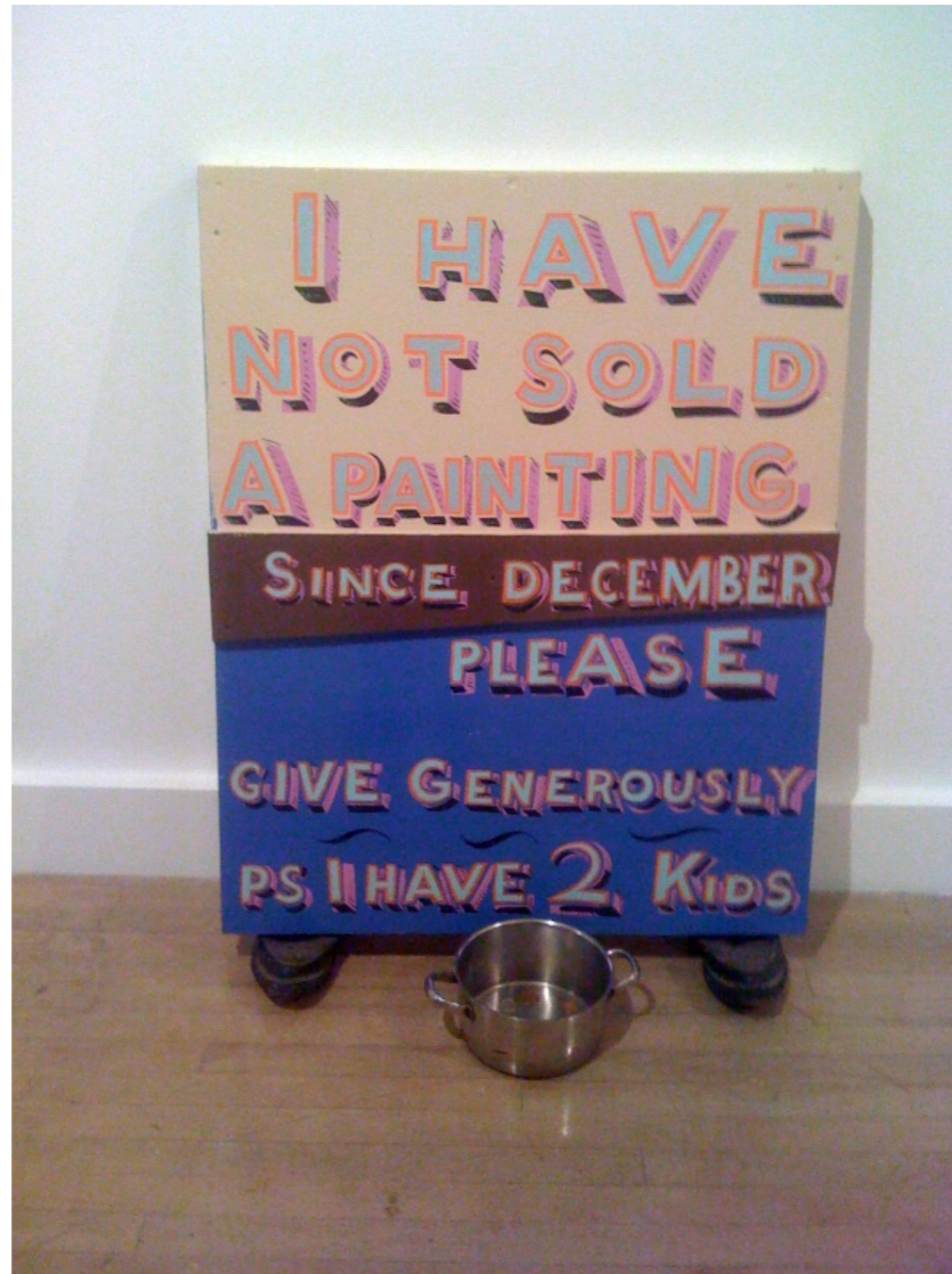
Bob & Roberta Smith (alias Patrick Brill), 2009, Tate Triennial, ,Altermodern, Nicolas Bourriaud